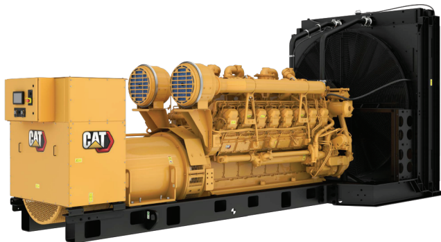
示意图与实际配置可能存在差异