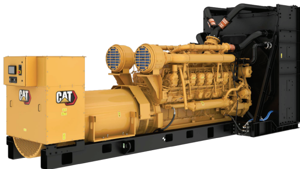
示意图与实际配置可能存在差异