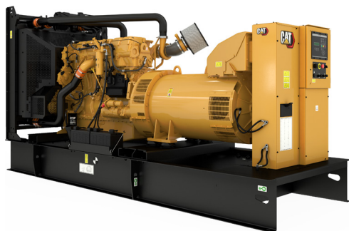
La imagen mostrada podría no reflejar la configuración real